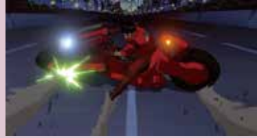
『AKIRA』©1988マッシュルーム/アキラ製作委員会

幻魔大戦(ゲストトーク有り) 7/21 13時~りんたろう監督、丸山正雄さん 料金：前売4000円 当日4500円 懇親会4000円(フード&指定ドリンク3杯)